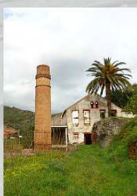
INGENIO SAN RAFAEL Benamargosa